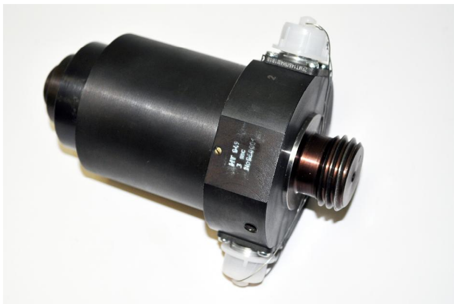
Рисунок 1 - Общий вид датчика НТ 049

Общий вид датчика НТ 049 приведен на рисунке 1, габаритные и установочные размеры – на рисунке 2.