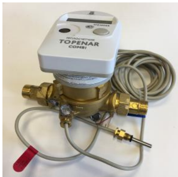
б) Модификация Топенар Комби.