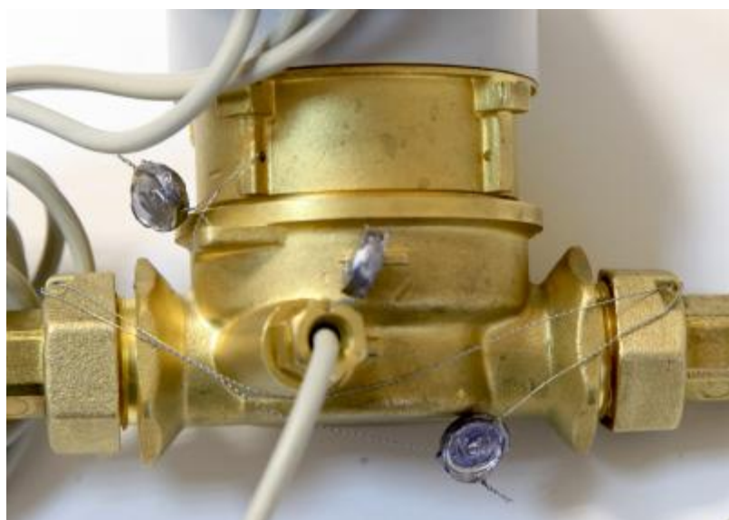
а) Места пломбирования энергоснабжающей организацией