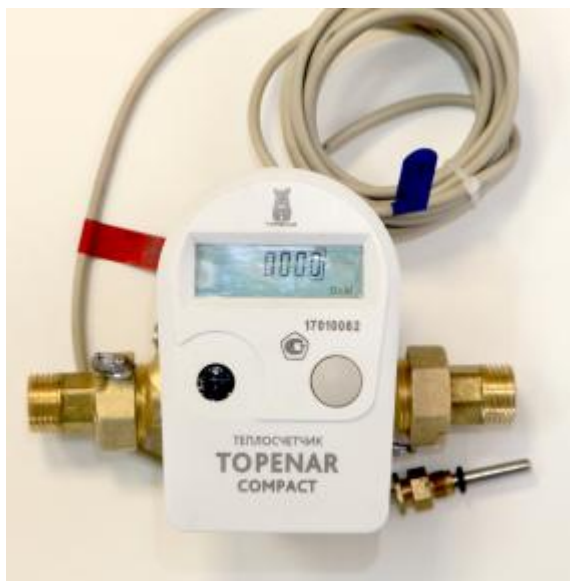
а) Модификация Топенар Компакт.