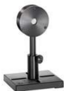
PE10/ PE10BB/ PE10-C / PE10BF-C

Общий вид преобразователей серии PE представлены на рисунке 1. Схема мест пломбирования приведена на рисунке 2.