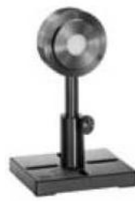
PE25 BF-DIF/ PE25BF-DIF-C