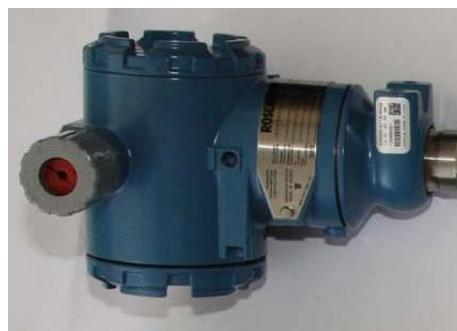
в) преобразователь давления 3051