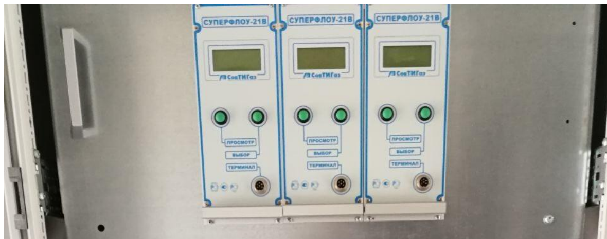
а) вычислители, установленные в шкафе

Общий вид средства измерений представлен на рисунке 1.