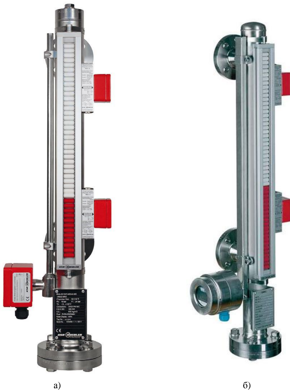
Рисунок 1 - Общий вид уровнемеров поплавковых байпасных УПБ 1015 а) без показывающего устройства; б) с показывающим устройством

На винт фиксирующий крышку измерительного преобразователя прямоугольной формы, либо фиксирующий металлическую скобу на измерительном преобразователе цилиндрической формы наносят краску или мастику. Схема пломбировки от несанкционированного доступа, обозначение мест нанесения знака поверки представлены на рисунке 2.