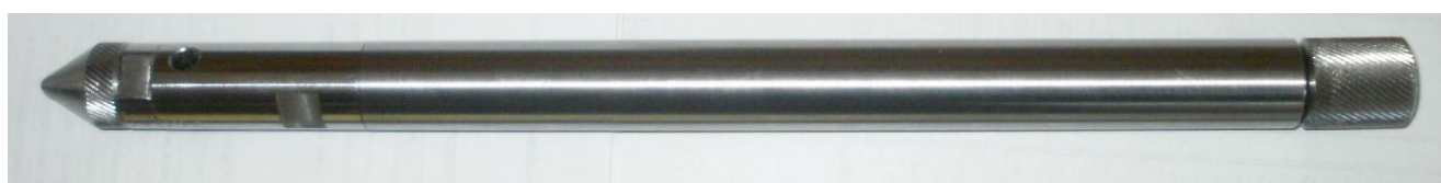
Рисунок 3 - Общий вид манометра-термометра глубинного АЦМ-6-20