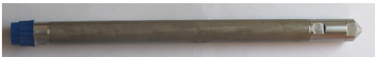
Рисунок 6 - Общий вид манометра-термометра глубинного АЦМ-6-25