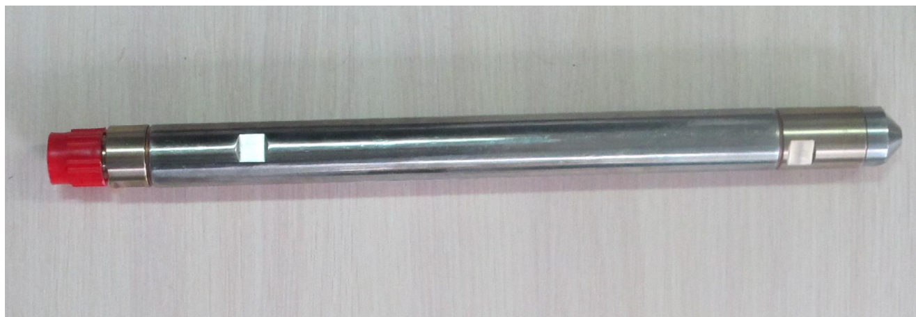
Рисунок 2 - Общий вид манометра-термометра глубинного АЦМ-6Г-30