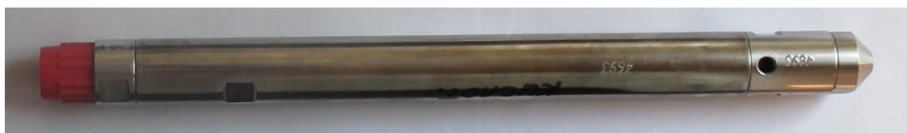
Рисунок 4 - Общий вид манометра-термометра глубинного АЦМ-6.1-30