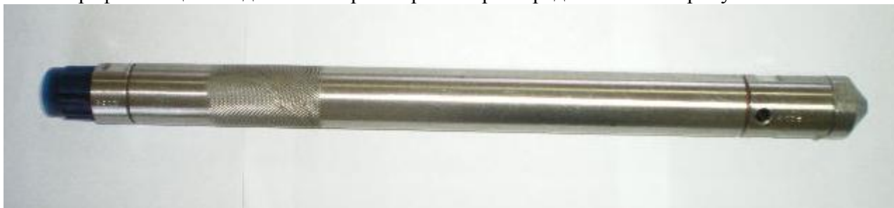
Рисунок 1 - Общий вид манометра-термометра глубинного АЦМ-6-30

Фотографии общего вида манометров-термометров представлены на рисунках 1-5.