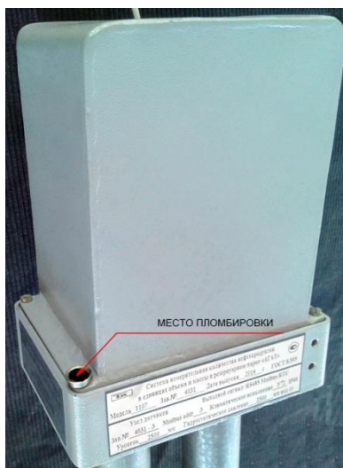
Рисунок 3 - Схема пломбировки от несанкционированного доступа систем «АГАТ-М»

Системы «АГАТ-М» имеют возможность подключения к ним дополнительных датчиков, работающих в индикаторном режиме: