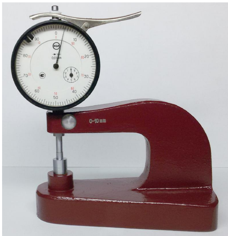
Рисунок 1 - Общий вид толщиномеров типов ТН-10, ТН-25