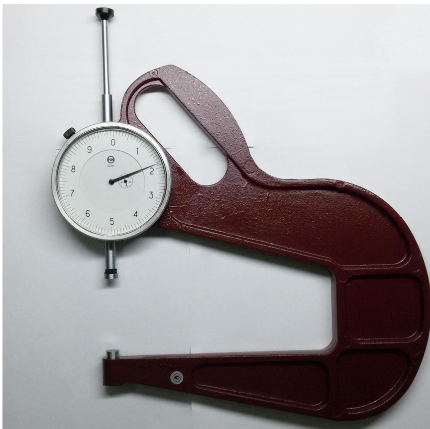
Рисунок 3 – Общий вид толщиномеров типов ТР-25Б, ТР-50Б

Пломбирование корпуса толщиномеров индикаторных с ценой деления 0,01 и 0,1 мм не предусмотрено.