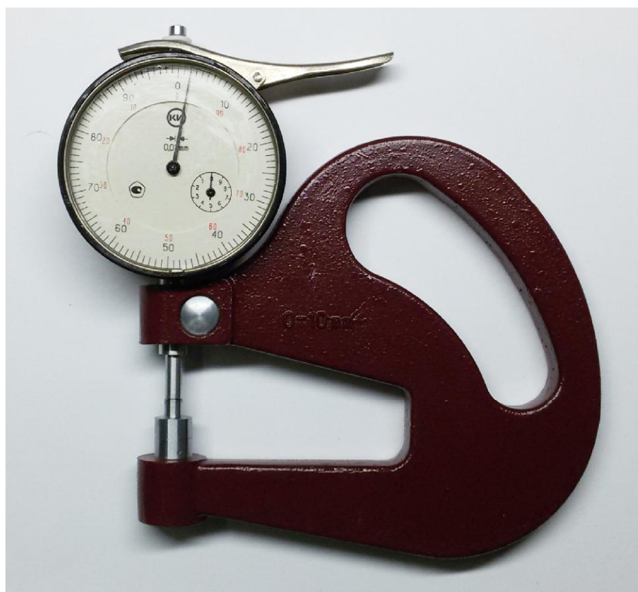
Рисунок 2 – Общий вид толщиномеров типов ТР-10, ТР-25