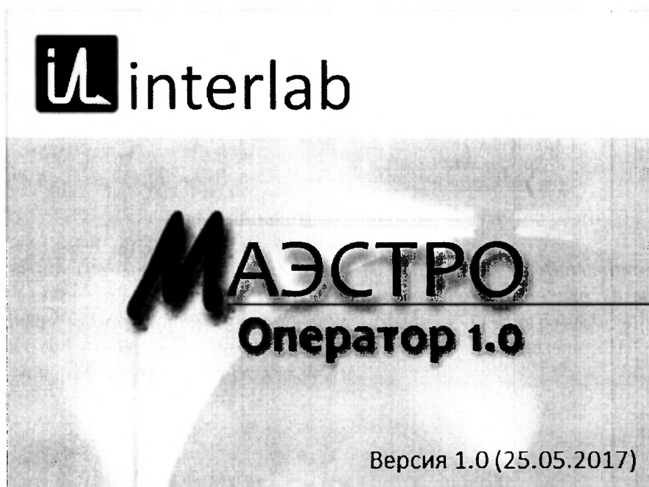
Рис.2 Окно с идентификационными данными программы Маэстро (Маэстро Оператор)

7.2.3.2 Для программы Маэстро (содержит разделы Маэстро Аналитик и Маэстро Оператор): в главном окне программы Маэстро, строке команд щелкнуть мышью на команду «Справка». В открывшемся окне щелкнуть мышью «О программе», в результате чего откроется окно, в котором приведены идентификационное название ПО и номер версии. Копии экранов приведены на рисунках 2 и 3.