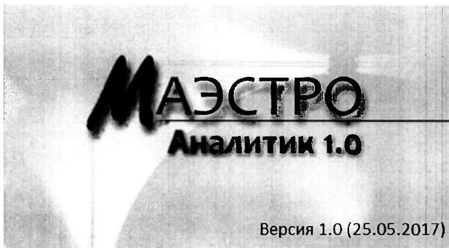
Рис.3 Окно с идентификационными данными программы Маэстро (Маэстро Аналитик)

7.2.4 Результаты поверки считать положительными, если версия автономного ПО Clarity – 7.1 и выше, ПО Маэстро (Маэстро Оператор и Маэстро Аналитик ) – 1.0 и выше.