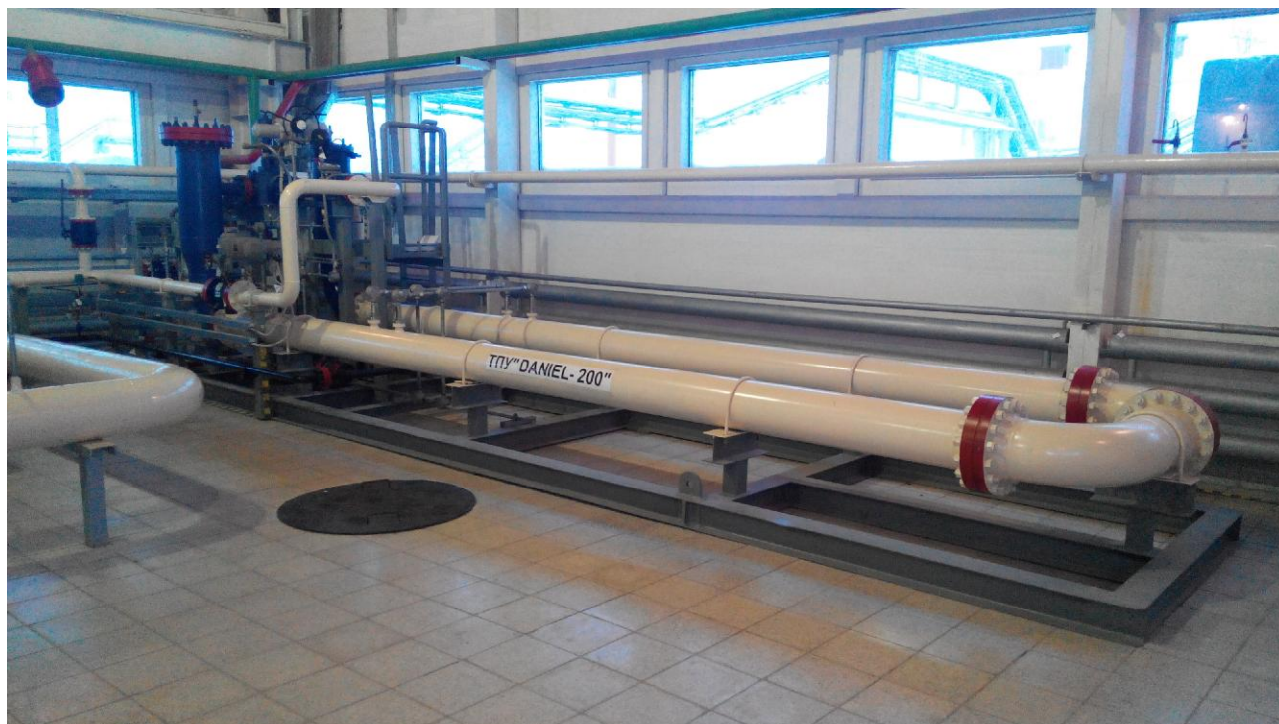
Рисунок 1 - Общий вид ТПУ