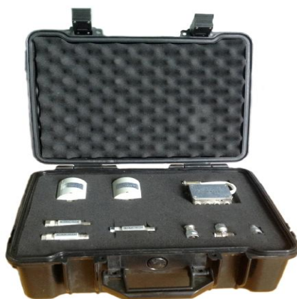
Рисунок 1 - Общий вид комплекта ПНТЭ-37

Общий вид комплекта ПНТЭ-37 приведен на рисунке 1.