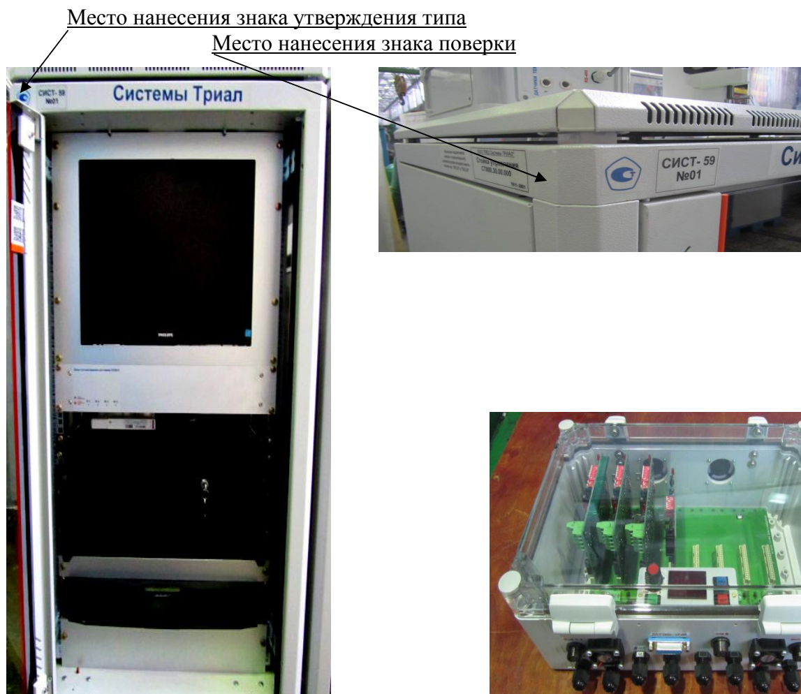
Рисунок 1 - Общий вид стойки управления