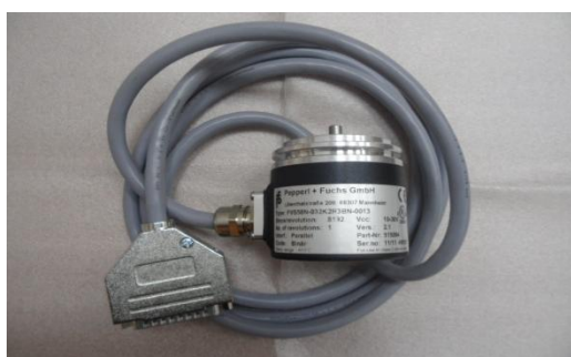
Рисунок 5 - Датчик угла FVS58