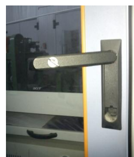
Рисунок 6 - Внешний вид замка на дверце стойки управления