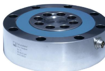
Рисунок 4 - Датчик силы U5