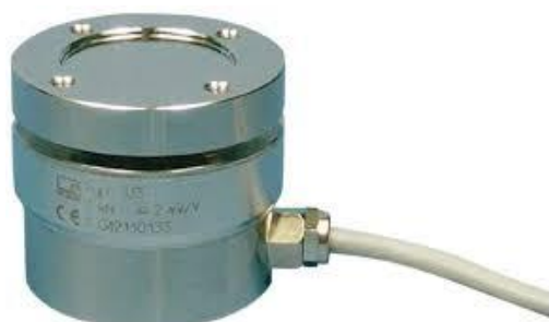
Рисунок 3 - Датчик силы U3