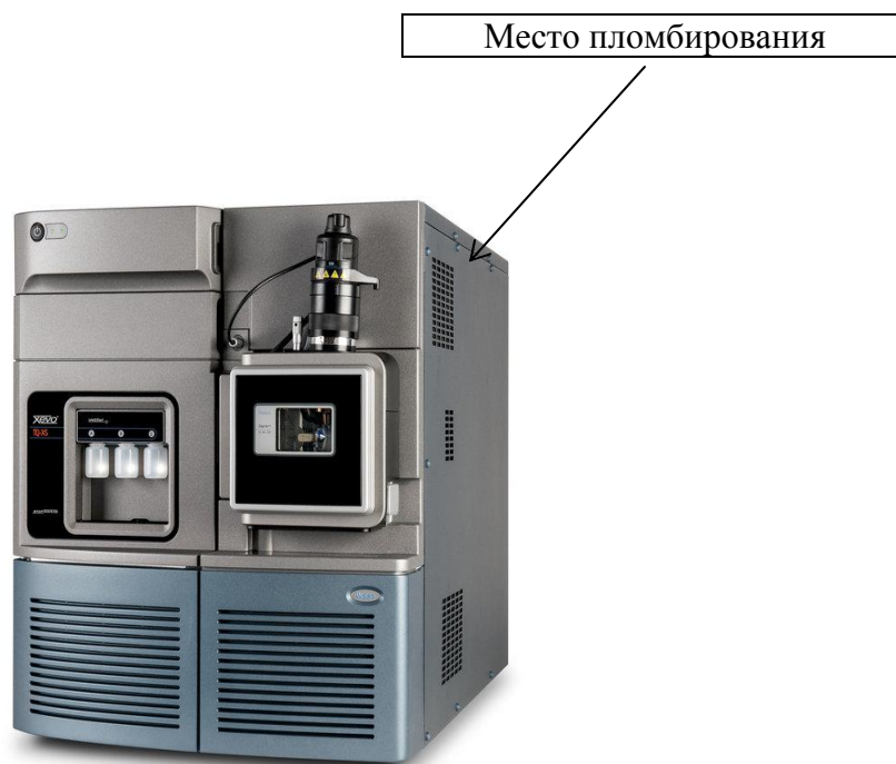
Рисунок 4 - Внешний вид масс-спектрометра Xevo TQ-XS