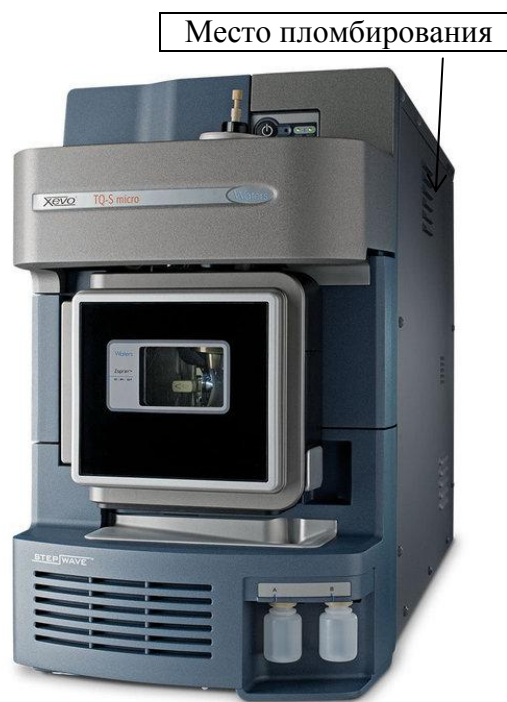
Рисунок 3 - Внешний вид масс-спектрометра Xevo TQ-S Micro