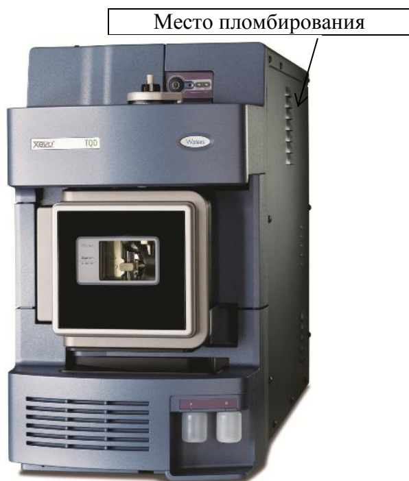
Рисунок 2 - Внешний вид масс-спектрометра Xevo TQD