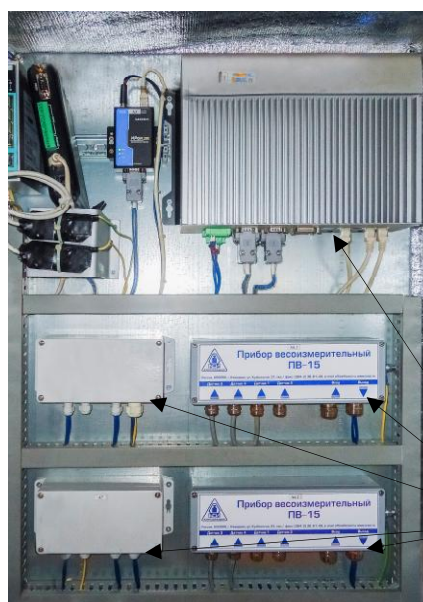
Рисунок 3 - Схема пломбировки от несанкционированного доступа

Схема пломбировки от несанкционированного доступа представлена на рисунке 3.