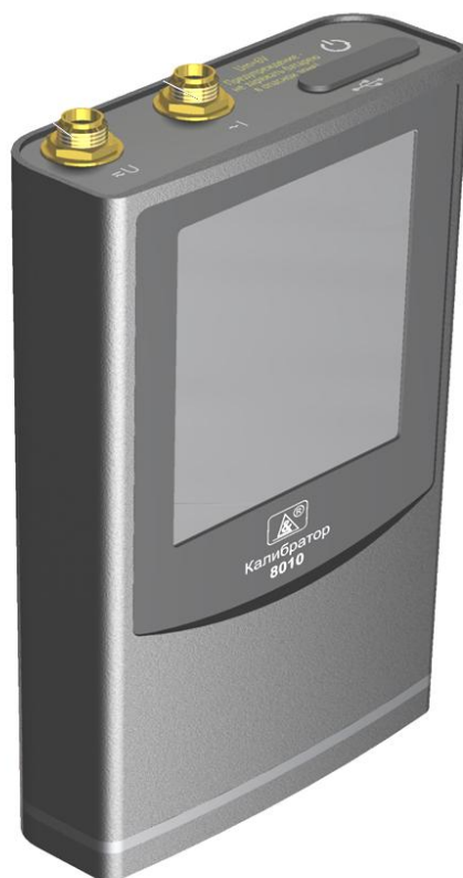
Рисунок 1 - Общий вид средства измерений

Схема пломбировки от несанкционированного доступа, обозначение места нанесения знака поверки представлены на рисунке 2.