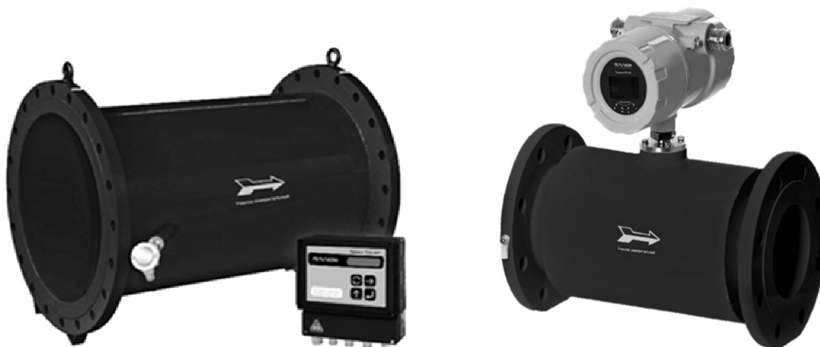
Рисунок 1 - Общий вид расходомеров-счетчиков ультразвуковых Геликон РУЛ

Общий вид расходомеров-счетчиков ультразвуковых Геликон РУЛ представлен на рисунке 1 и 2.