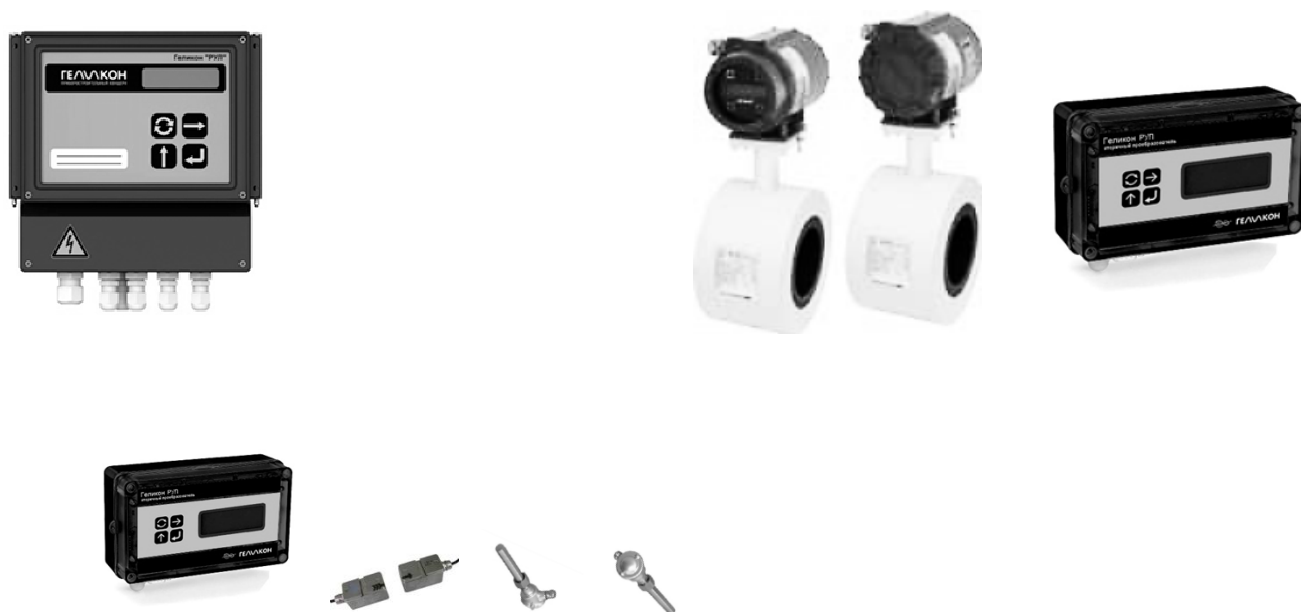
Рисунок 2 - Общий вид расходомеров-счетчиков ультразвуковых Геликон РУЛ

Пломбирование расходомеров-счетчиков ультразвуковых Геликон РУЛ осуществляется с помощью проволоки и свинцовой (пластмассовой) пломбы, или пластической массой в чашку (углубление), установленную на винты крепления электронных блоков. Схема пломбировки от несанкционированного доступа, обозначение места нанесения знака поверки расходомеров-счетчиков ультразвуковых Геликон РУЛ представлены на рисунке 3.