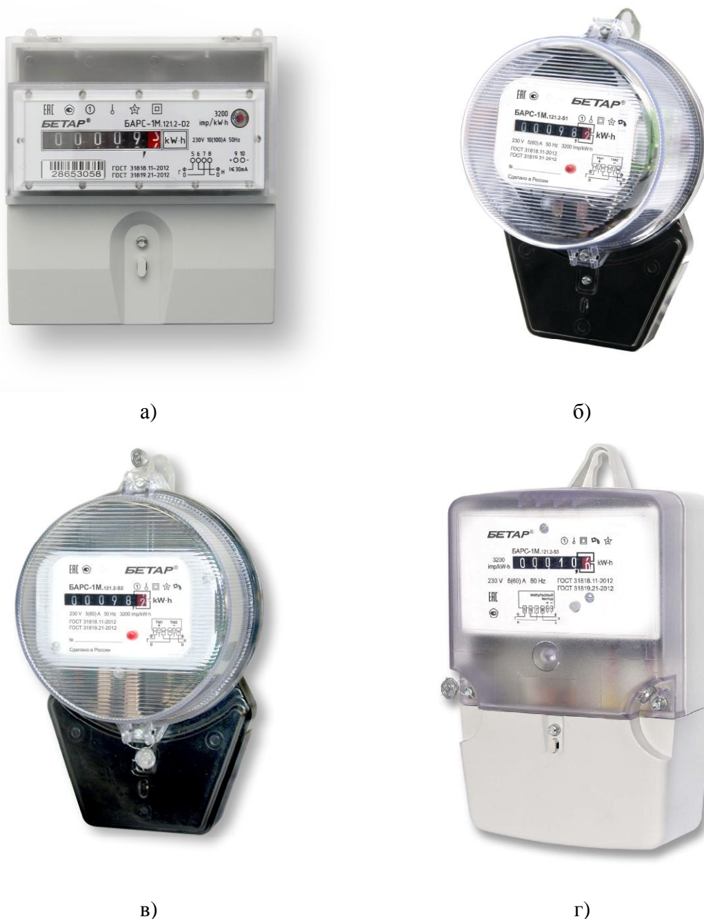
Рисунок 1 - Общий вид счетчиков электрической энергии однофазных статических БАРС-1М

Схема пломбировки от несанкционированного доступа, обозначение места нанесения знака поверки представлены на рисунке 2.