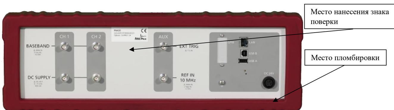
Рисунок 2 - Общий вид задней панели анализаторов