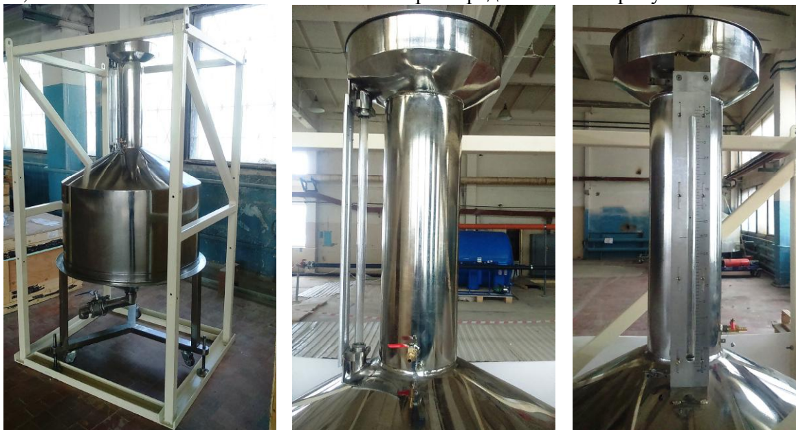
Рисунок 1 – Общий вид мерника металлического эталонного 1-го разряда JLQ-447,6

Пломбирование мерника металлического эталонного 1-го разряда JLQ-447,6 осуществляется нанесением знака поверки давлением на свинцовые пломбы, установленные на проволоках, пропущенных через отверстия в сливном кране, кране для регулировки жидкости на горловине и на винте регулировки шкалы. Схема пломбировки от несанкционированного доступа, обозначение места нанесения знака поверки представлены на рисунке 2.