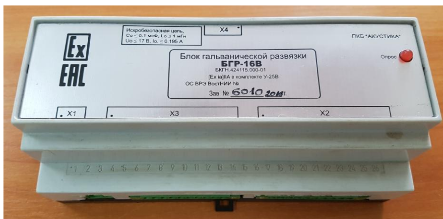
Рисунок 6 – Общий вид блока гальванической развязки (БГР)

На рисунке 7 указано место пломбировки на корпусе уровнемеров.