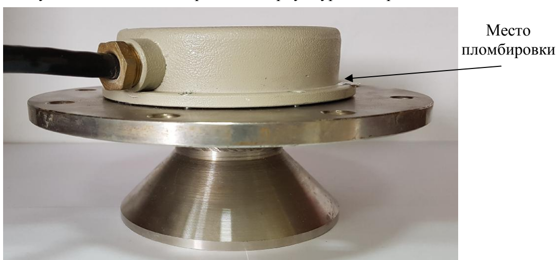
Рисунок 7 – Место пломбировки на корпусе уровнемеров.

На рисунке 7 указано место пломбировки на корпусе уровнемеров.