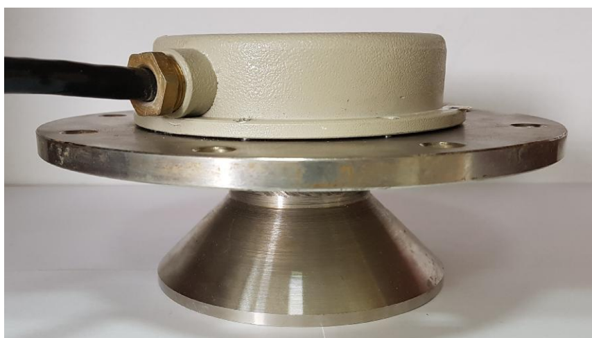
Рисунок 4 – Общий вид уровнемеров У-25С