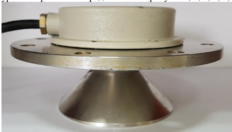
Рисунок 1 – Общий вид уровнемеров У-25

Общий вид уровнемеров и БГР представлен на рисунках; 1, 2, 3, 4, 5, 6.