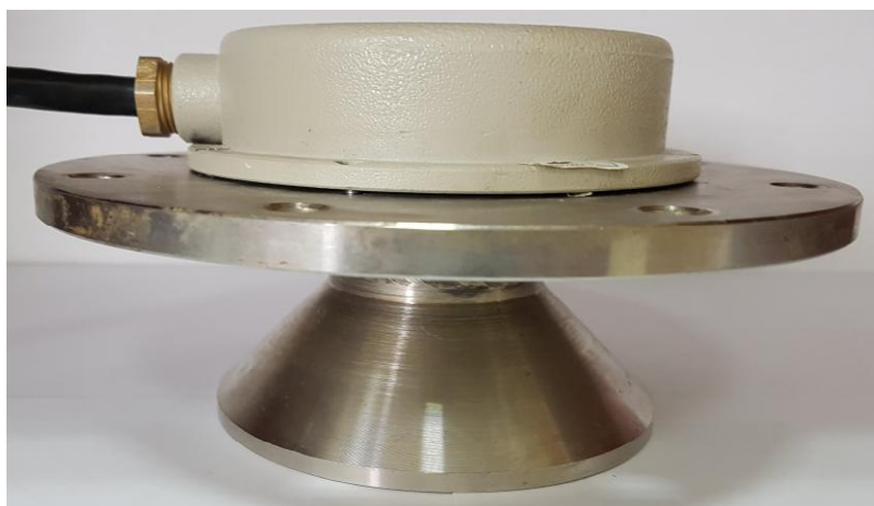
Рисунок 2 – Общий вид уровнемеров У-25В