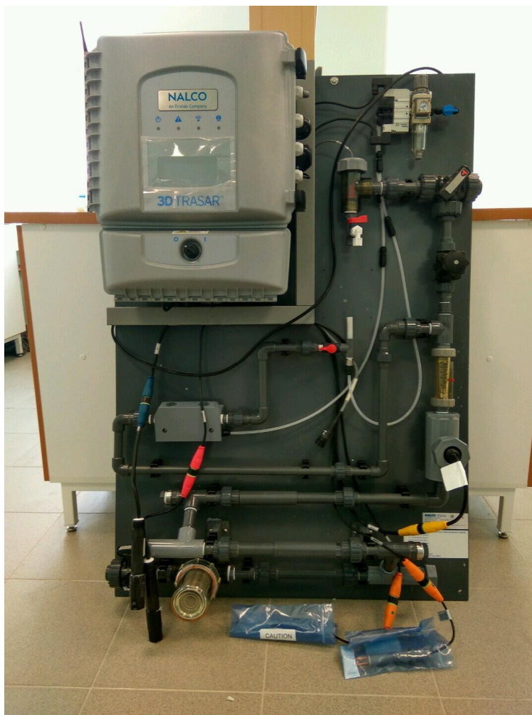
Рисунок 1 - Общий вид установки управления водно-химическим режимом 3D Trasar модели 3DT-CW8214.88