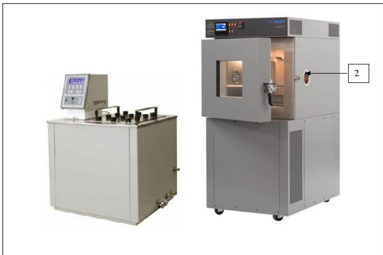
Рисунок 1 - Общий вид наборов стационарных поверочных для средств измерений температуры СПН-2 1 - модуль измерительный, 2 - модуль задания температуры.