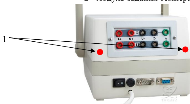
Рисунок 2 - Схема пломбирования наборов стационарных поверочных для средств измерений температуры СПН-2 1 - пломбы на корпусе преобразователя сигналов ТС и ТП прецизионного Теркон.