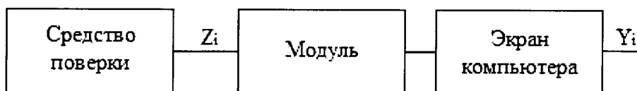
Рисунок 1 - Схема подключений при определении погрешностей ИК, реализующих линейное аналого-цифровое преобразование сигналов силы или напряжения постоянного электрического тока, частоты следования импульсов

где N – нормирующее значение (в зависимости от типа проверяемого ИК).