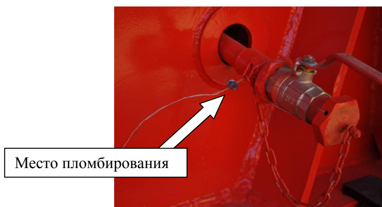
Рисунок 5 - Кран слива отстоя из УЗСТ ППЦ и УЗСТ ПЦ