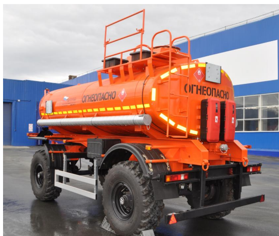
Рисунок 3 - Общий вид УЗСТ ПЦ с одной секцией