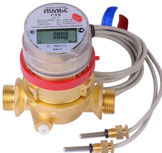
Рисунок 1 – Общий вид теплосчетчиков