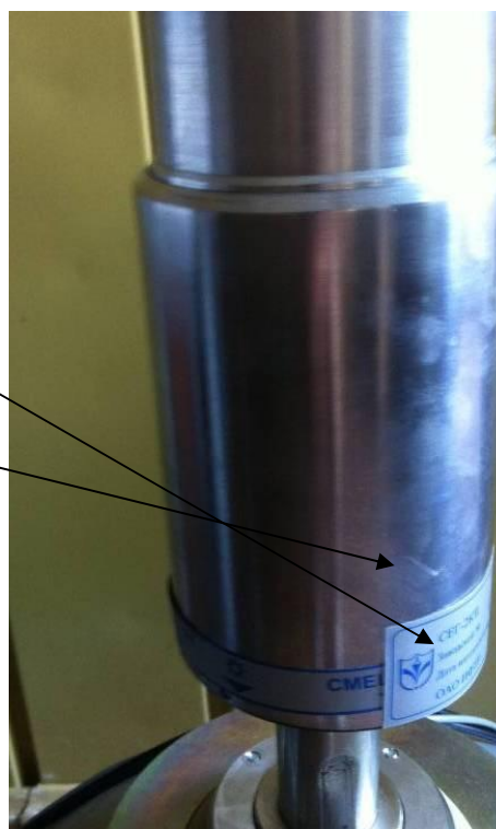
Рисунок 2 - Схема пломбировки от несанкционированного доступа и обозначение места нанесения знака поверки