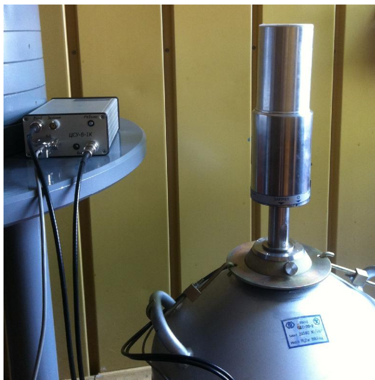
Рисунок 1 - Общий вид спектрометра СЕР-1КП-(К-7К) или СЕР-1КП-(Г-7К)