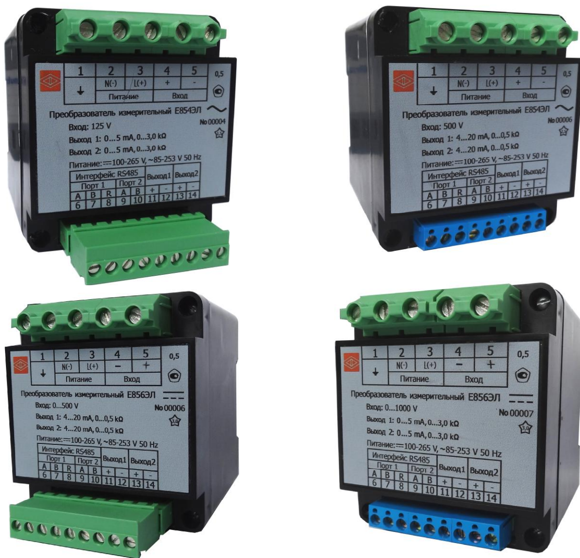
Рисунок 1 – Общий вид преобразователей измерительных переменного тока и напряжения E854ЭЛ, постоянного тока и напряжения E856ЭЛ