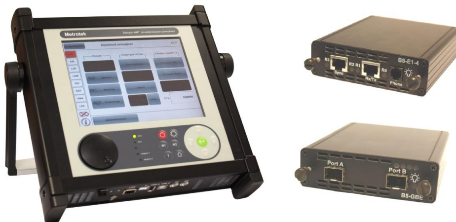
Рисунок 1 – Внешний вид анализатора в переносном варианте и сменных модулей