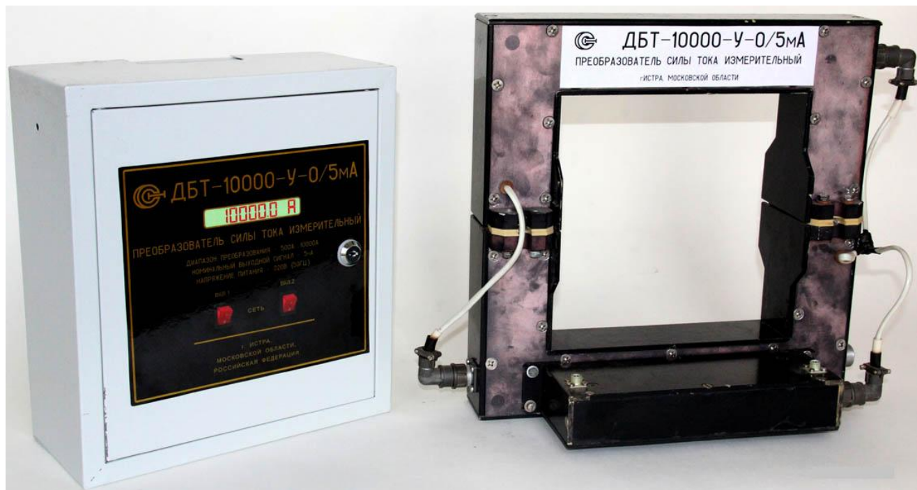
Рисунок 2 – Общий вид преобразователя ДБТ-10000-У-0/5