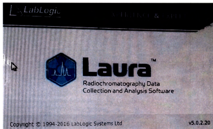
Рис.1 Отображения версии исполняемых файлов

7.2.2.3 Для определения версии файла необходимо в диалоговом окне активировать в меню вкладку Help, затем вкладку Info. В открывшемся окне будут отображены наименование и версия программы (рис.1). Отображенный номер версии должен быть не ниже указанного в описании типа.