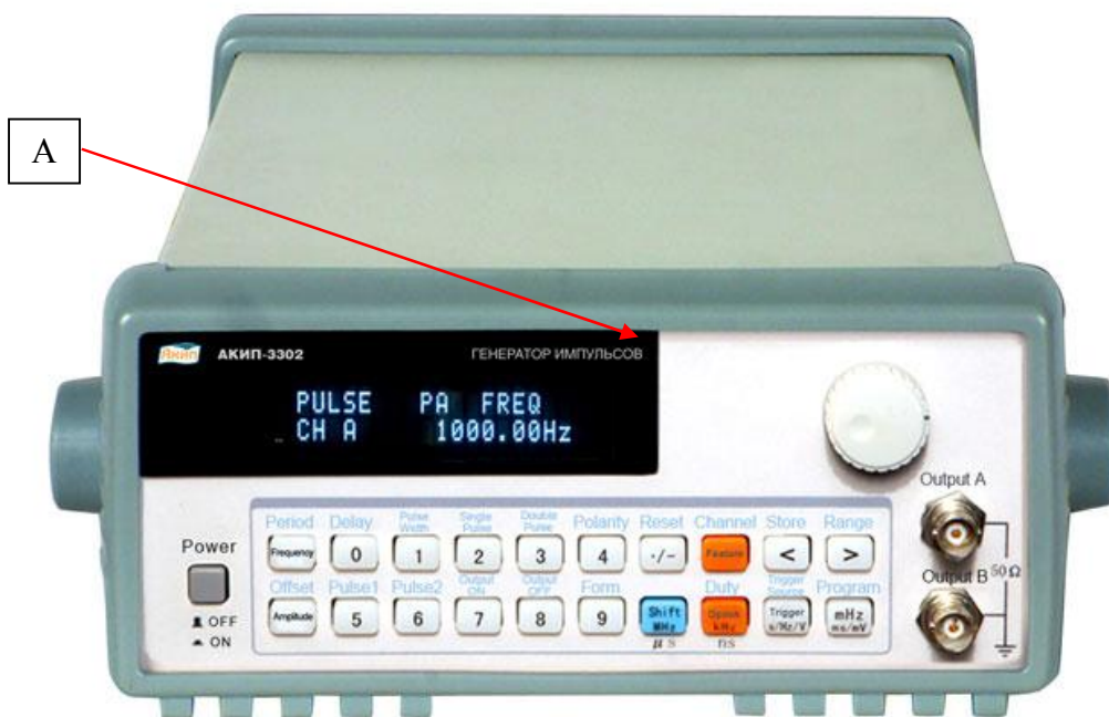
Рисунок 1 – Внешний вид генераторов модификаций АКІП-3301, АКІП-3302 и место нанесения знака утверждения типа (А)