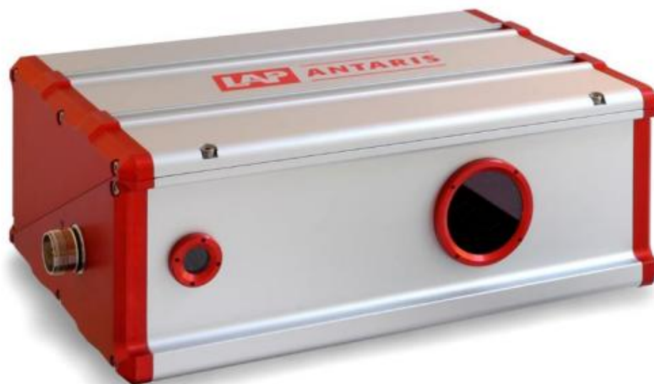
Рисунок 3 - Общий вид датчиков серии Antaris

Ограничение несанкционированного доступа к узлам датчиков обеспечено нанесением пломбирующих наклеек.