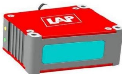
Рисунок 1 - Общий вид датчиков серии Atlas

Общий вид датчиков представлен на рисунках 1-3.