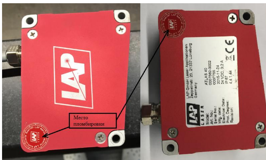
Рисунок 4 - Схема пломбировки датчиков серии Atlas

Схема пломбировки от несанкционированного доступа представлена на рисунках 4-6.