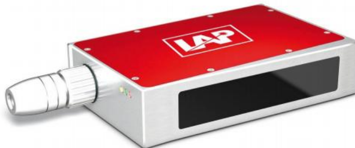
Рисунок 2 - Общий вид датчиков серии Polaris