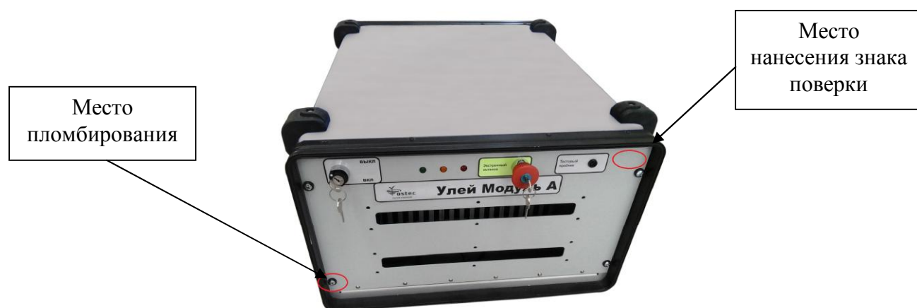
Рисунок 1 - Внешний вид модуля «А»

Внешний вид систем, с указанием мест пломбирования и нанесения знака поверки, приведен на рисунках 1, 2 и 3.