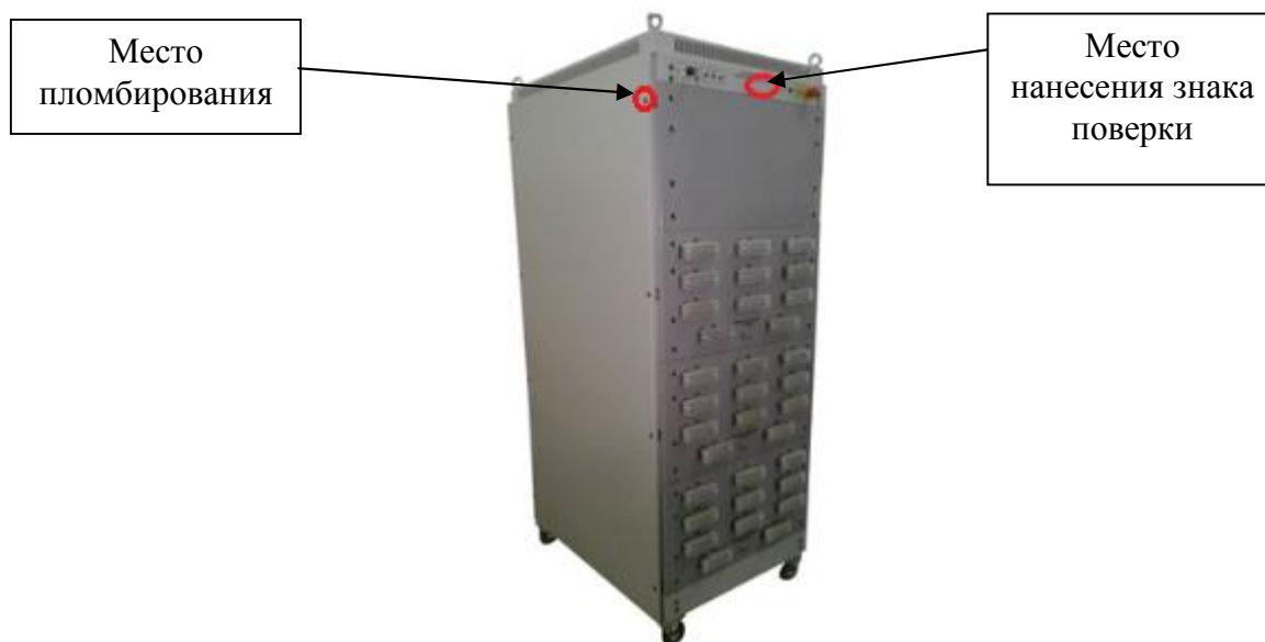
Рисунок 3 - Внешний вид модуля «С»