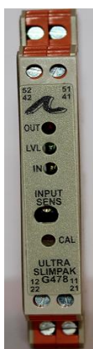
Торцевая панель Рисунок 1

Общий вид преобразователя G478-0001 показан на рисунках 1, 2, 3.