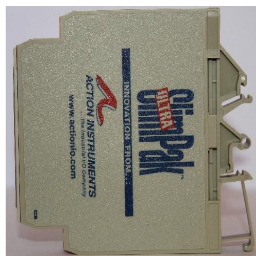
Правая боковая панель Рисунок 3