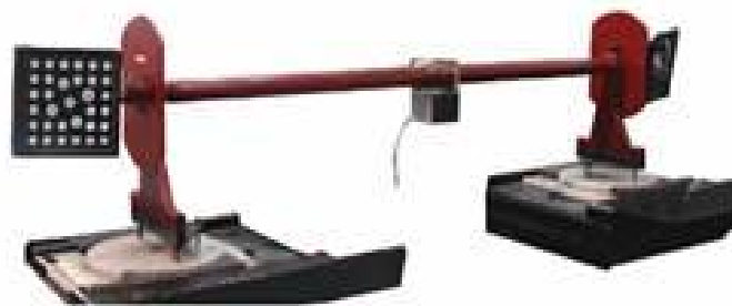
Рисунок 2 - Общий вид приспособлений калибровочных для устройств для измерений углов установки колес автомобилей ЕАК0305J39А