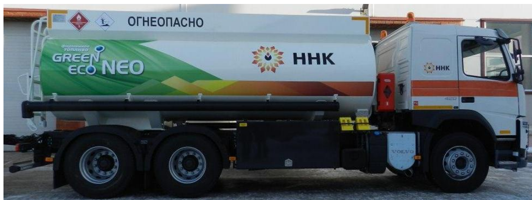
Рисунок 1 - Общий вид автоцистерны АЦ-17-FM

Общие виды АЦ-17 и ПЦ-13 представлены на рисунках 1 и 2.