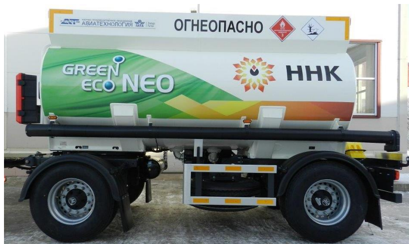
Рисунок 2 - Общий вид прицепа-цистерны ПЦ-13

Схема пломбировки для защиты от несанкционированного изменения положения указателя уровня налива, обозначение места нанесения знака поверки представлены на рисунке 3.