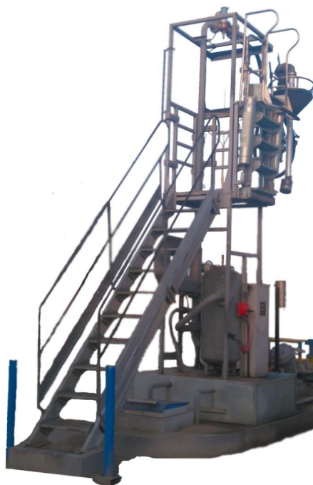
Рисунок 1 - Общий вид установок автоматизированных налива нефтепродуктов в автоцистерны АСН-ВН