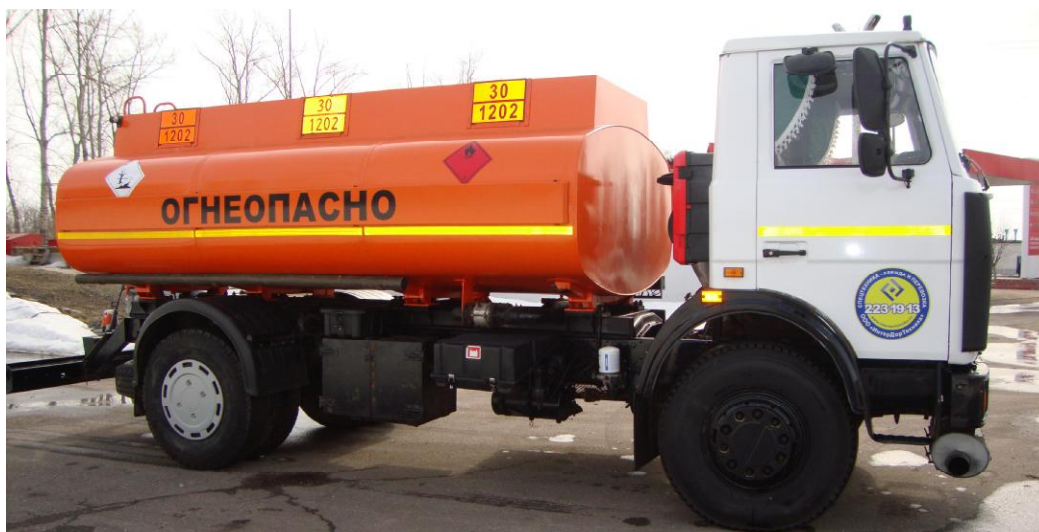
Рисунок 1 - Общий вид автотопливозаправщика АТЗ-10

Общий вид АТЗ-10 представлен на рисунке 1.