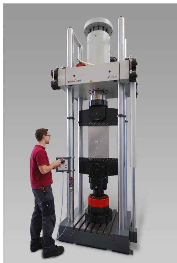
Рисунок 4 - Общий вид машин универсальных испытательных HB1000, HB2500, HB3000