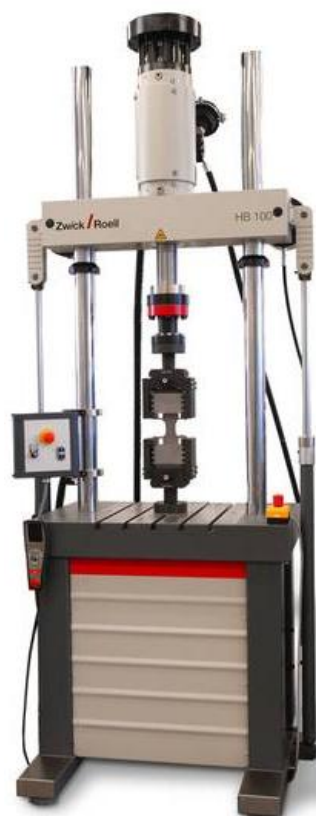
Рисунок 2 - Общий вид машин универсальных испытательных HB50, HB100, HB250, HB500