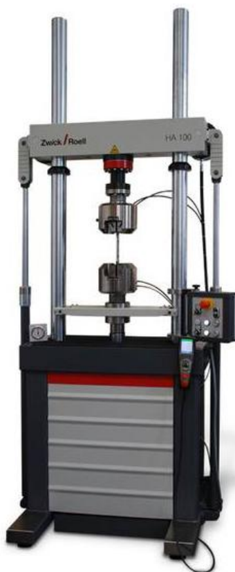
Рисунок 3 - Общий вид машин универсальных испытательных HA50, HA100, HA250, HA500