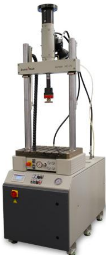
Рисунок 1 - Общий вид машин универсальных испытательных HC10, HC25