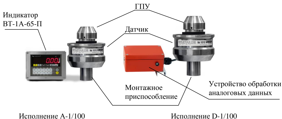
Рисунок 1 - Общий вид весов

Общий вид весов представлен на рисунке 1.