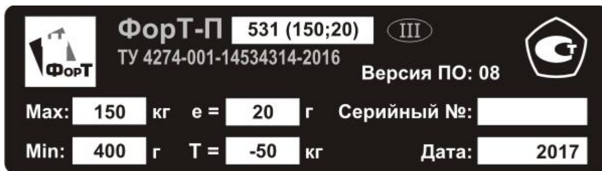
Рисунок 2 - Общий вид маркировочной таблички

Маркировка весов выполнена в виде таблички, закрепленной на боковой стенке корпуса весов, на которой нанесены следующие данные (в скобках указаны соответствующие пункты ГОСТ OIML R 76-1-2011):