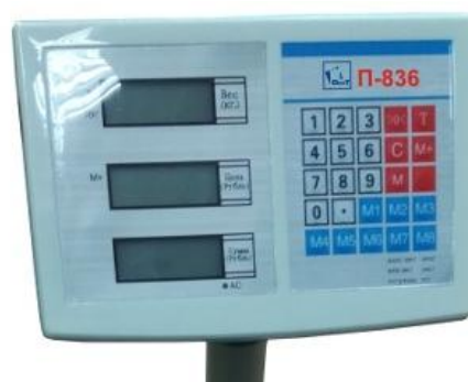
Рисунок 1 - Общий вид весов электронных товарных ФОРТ-П