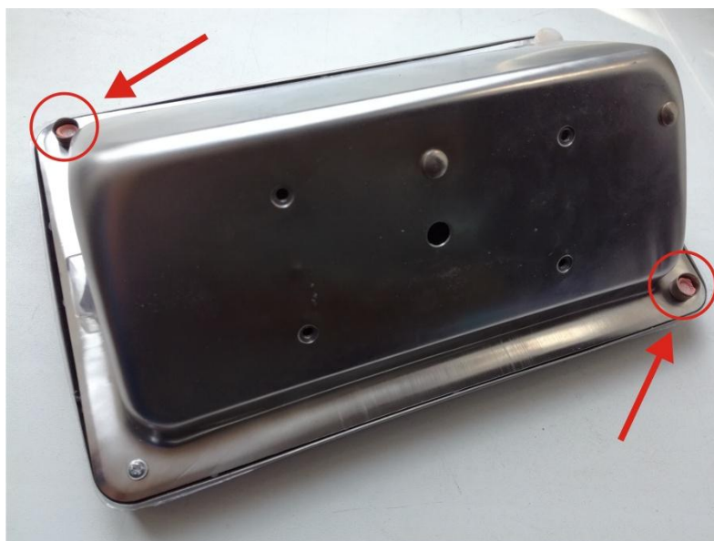
Рисунок 3 - Схема пломбировки

На электронной плате весов располагается «джампер», который необходимо переставить для перехода весов в режим «калибровка». Ограничение доступа к «джамперу» осуществляется пломбировкой корпуса индикатора. Пломбы должны быть расположены в конструктивных углублениях корпуса индикатора весоизмерительного на винтах, соединяющих его нижнюю и верхнюю части. Пломбировке подлежат минимум два винта, расположенные диагонально друг относительно друга. Пример мест пломбировки представлен на рисунке 3.