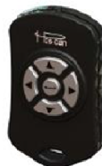
Рисунок 2 - Общий вид пульта ДУ