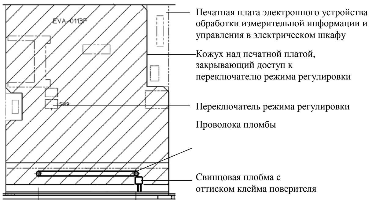
Рисунок 4 - Схема пломбировки печатной платы электронного устройства обработки измерительной информации и управления