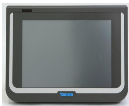
Рисунок 2 - Внешний вид показывающего устройства

Схема пломбировки от несанкционированного доступа и обозначение места нанесения знака поверки представлены на рисунках 3 и 4.