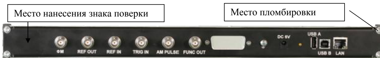
Рисунок 5 - Общий вид лицевой панели генераторов сигналов RFSG12, RFSG20, RFSG26 с опциями RFSG12-1URM, RFSG20-1URM, RFSG26-1URM соответственно