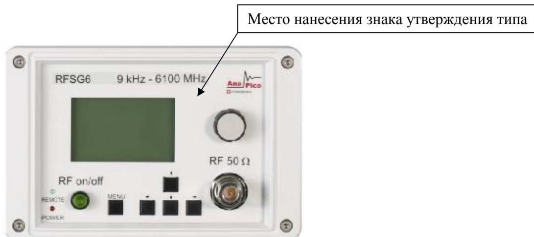
Рисунок 1 - Общий вид лицевой панели генераторов сигналов RFSG2, RFSG4, RFSG6

Общий вид генераторов с указанием мест нанесения знака поверки, знака утверждения типа и пломбирования приведен на рисунках 1 - 6.