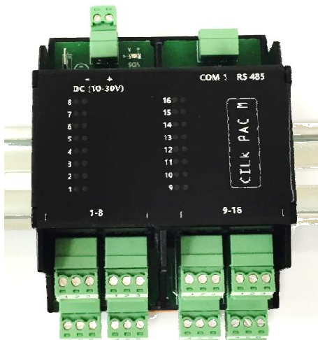
Рисунок 3 - Общий вид шасси расширения CilkPAC M

На рисунке 3 представлен общий вид шасси расширения CilkPAC M.