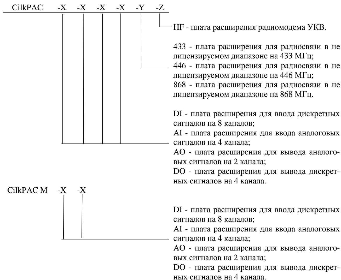
Рисунок 1 - Схема структурного обозначения контроллеров

Общий вид процессорного модуля контроллера представлен на рисунке 2.