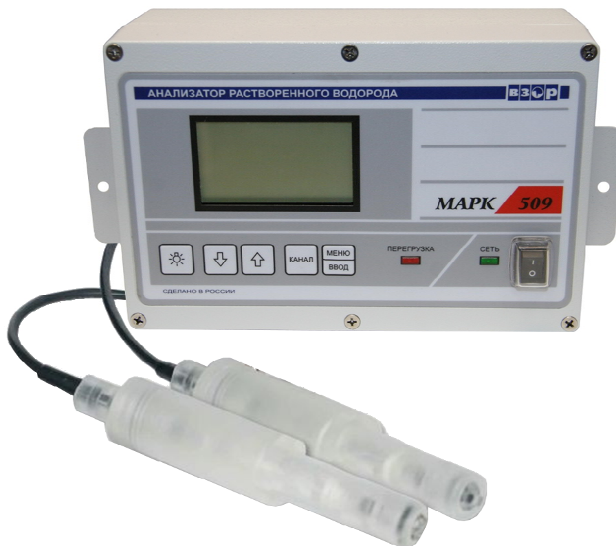
Рисунок 1 - Общий вид анализатора растворенного водорода МАРК-509