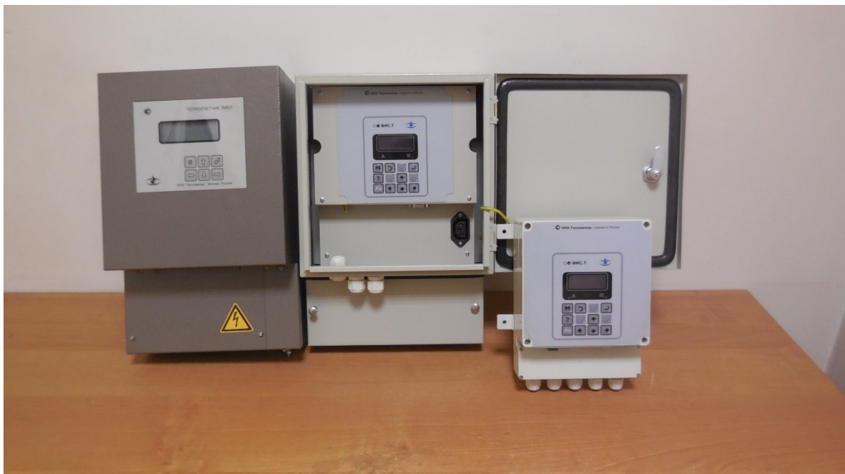
Внешний вид электронных блоков