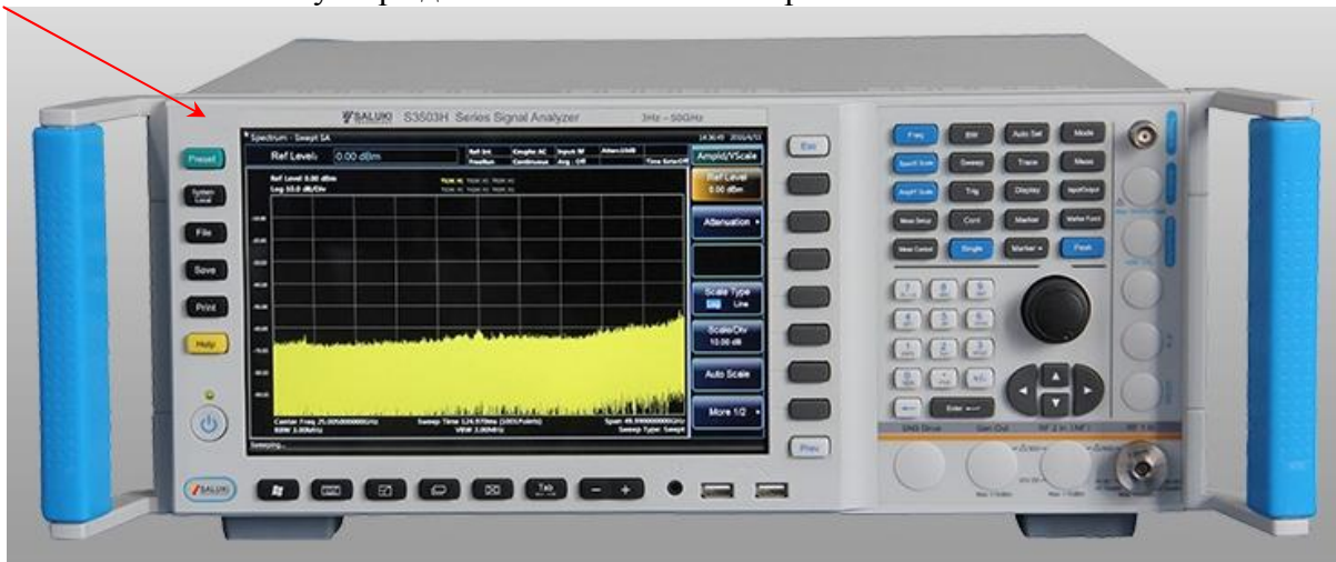
Рисунок 1 - Вид лицевой панели

место нанесения знака утверждения типа и знака поверки