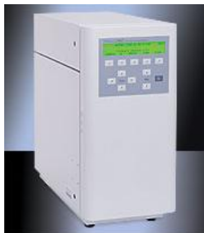
Рисунок 5 - Общий вид электрохимического детектора Waters 2465