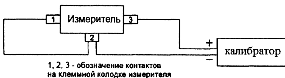
Рисунок 1 – Схема подключения